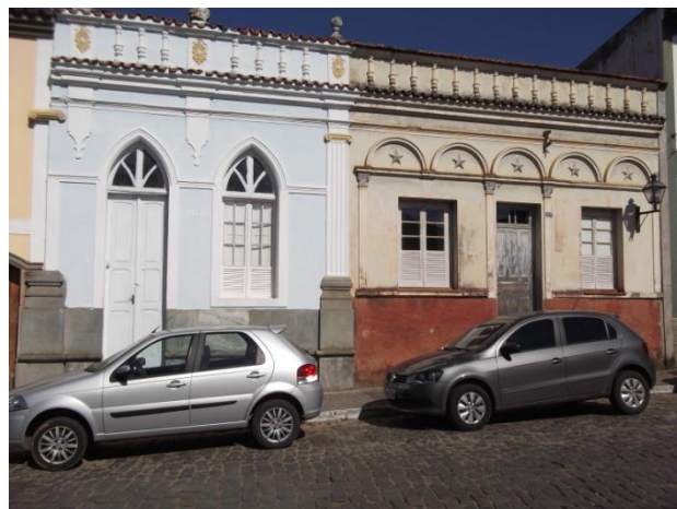
Imóveis de número 107 e 113