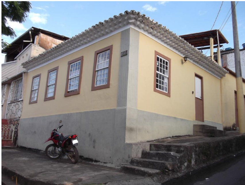
Imóvel Rua João Mourão com Rua Aureliano Raposo, número 152 Em 15 de outubro de 2013