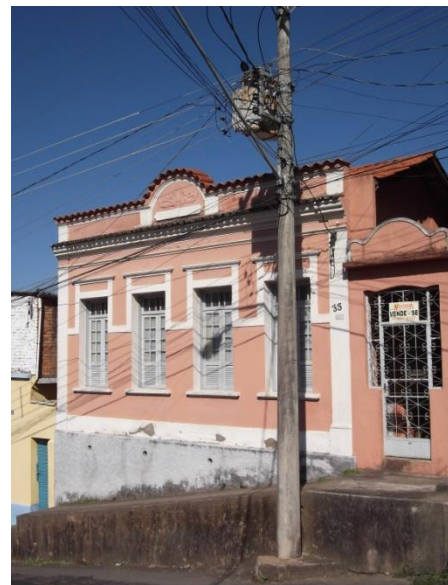
Imóvel Rua Aureliano Raposo, nº 35 Em 26 setembro de 2013