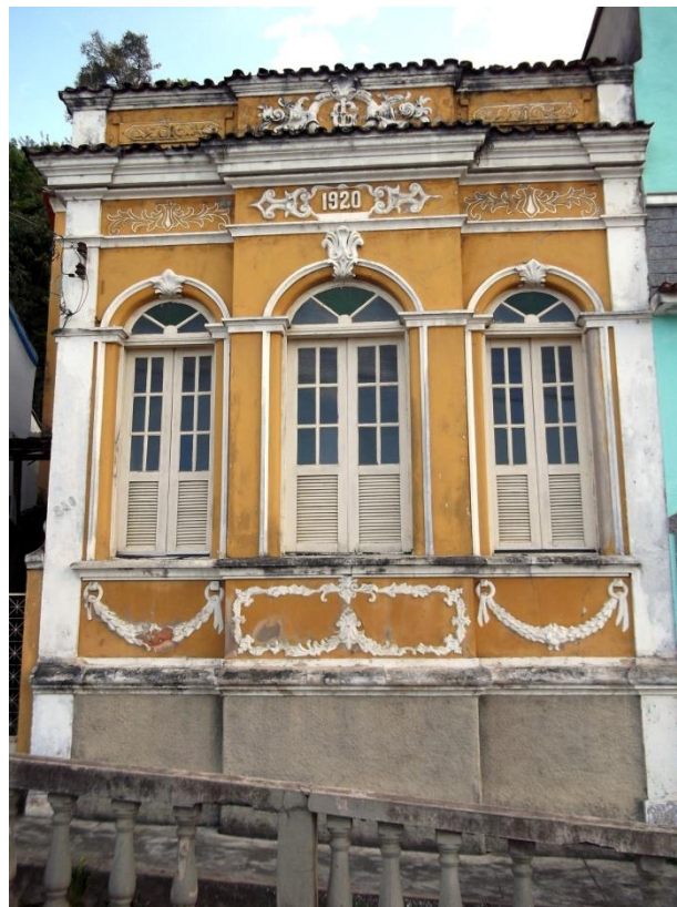
Fachada do imóvel Rua João Mourão, 240 Em 15 de outubro de 2013