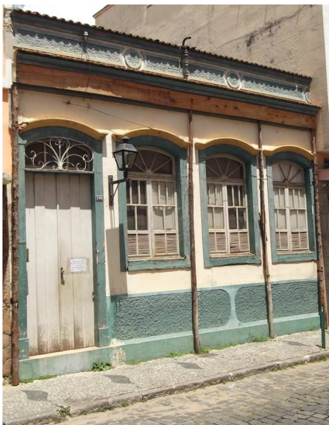
Fachada do imóvel da Rua Marechal Deodoro, 196 - Centro de São João del-rei - MG